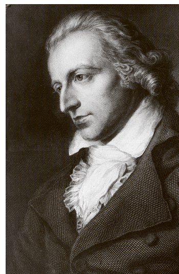
Die grossen deutschen Dichter Johann Wolfgang von Goethe (links) und Friedrich Schiller arbeiteten für das Stück «Wilhelm Tell» eng zusammen.