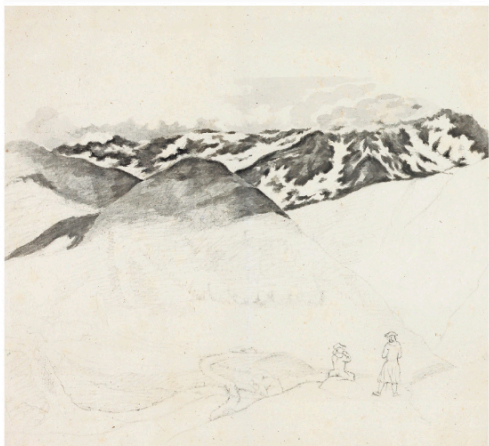
Diese Skizze fertigt Goethe auf dem Gotthard – Blick nach Süden – 1776 an.

Dreimal bereist Johann Wolfgang von Goethe die Schweiz. Jedes Mal bildet der Gotthard den Höhepunkt der Reise. Doch auf dem Weg nimmt der deutsche Dichter auch den Kanton Uri unter die Lupe. So einiges notiert er darüber in seinem Tagebuch. Wie mühselig ihm der Aufstieg durch die Schöl-